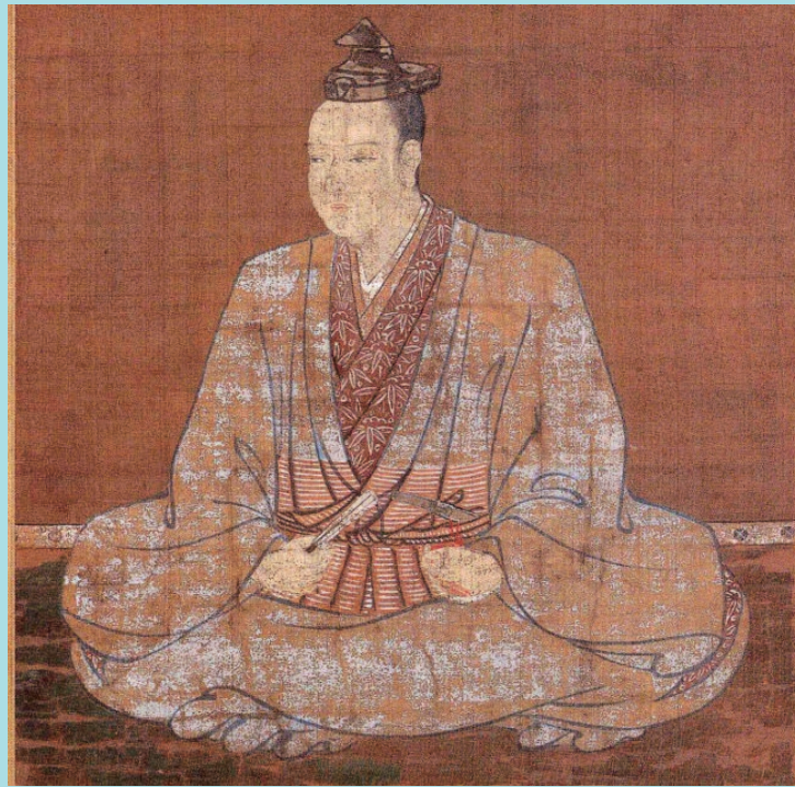
明智光秀像 (本徳寺蔵)