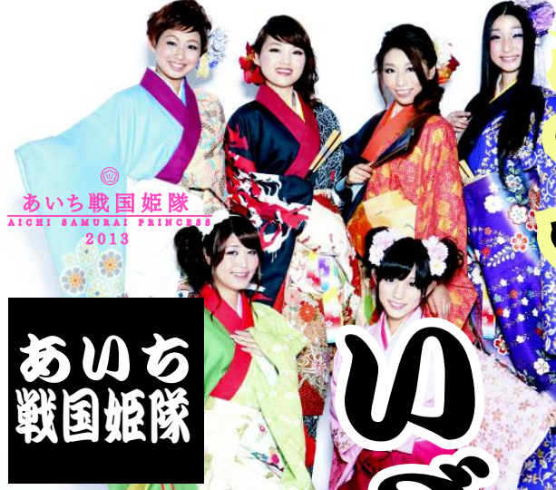
あいち戦国姫隊 AICHI SAMURAI PRINCESSES 2013